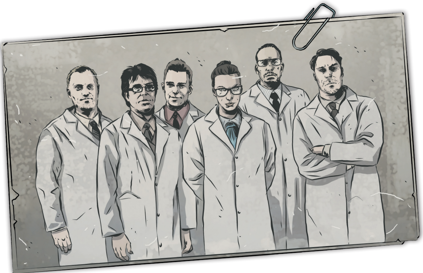
AIDE DE JEU 5 : LA PHOTO