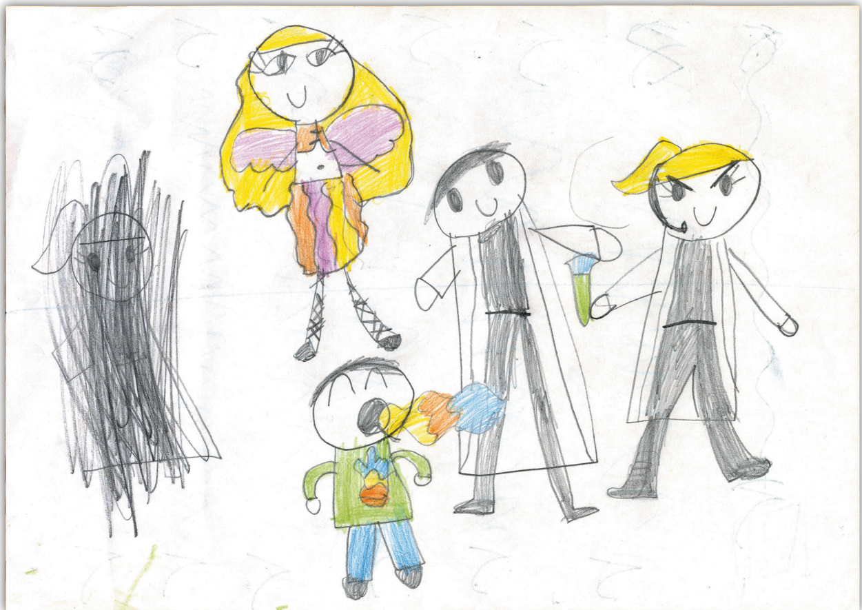
AIDE DE JEU 4 : LE DESSIN D'ENFANT